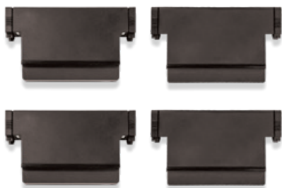
STDA128 (2 к-та = 4 батареи) 2 стандартные батареи и 2 запасные