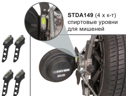
STDA149 (4 х к-т) спиртовые уровни для мишеней

2 пары 4-х точечных колесных захватов общего пользования