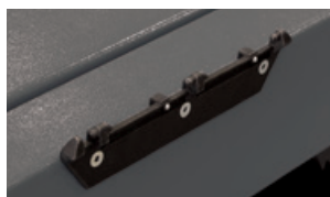
STDA117 пара скоб для крепления на подъемнике