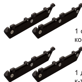
1 стандартный комплект