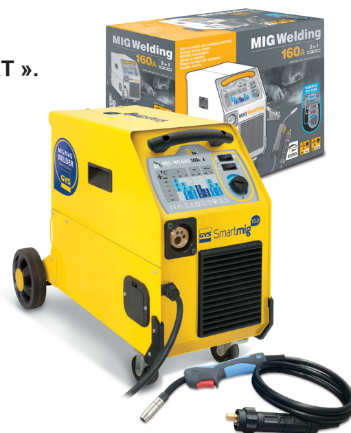
Поставляется с кабелем массы и Евро горелкой 2м.

Стабильная подача проволоки благодаря мощному подающему устройству на 40W.