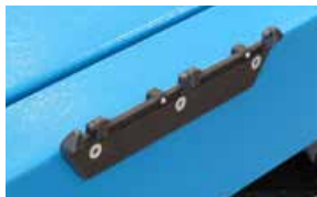
STDA117 (2 x kit)