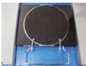
STDA124 (2 x kit)

Piatti rotanti Turntables Drehplatten Plateaux pivotants Platos giratorios