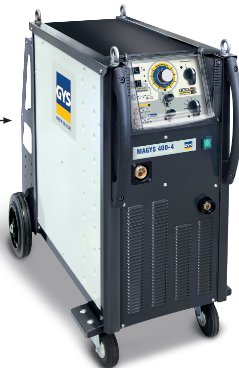
Аппарат поставляется без аксессуаров арт. 032170