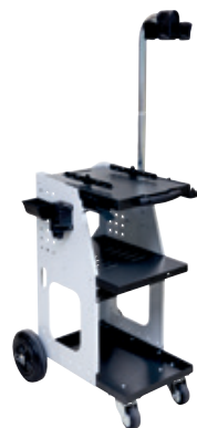
ref. 051331 + 052284 UNIVERSAL 800 + кронштейн