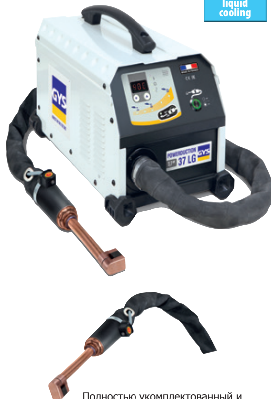
Полностью укомплектованный и смонтированный источник с 1 индуктором 90°.