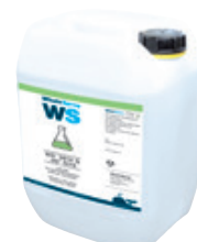
ref. 062511 специальная сварочная охлаждающая жидкость - 5 л