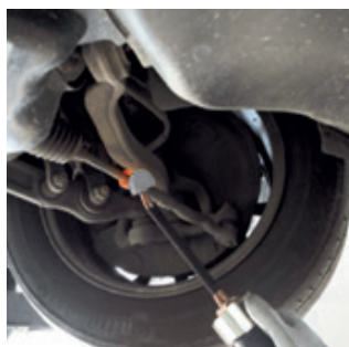
Раскрепления продольной рулевой тяги.