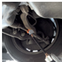
Раскрепления продольной рулевой тяги